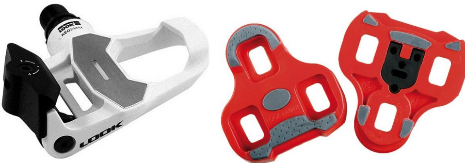
Look Kéo Pedalsystem für Rennrad. Bauform vor Jahr 2004 ist nicht kompatibel