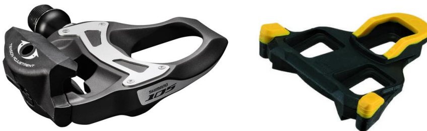
SPD-SL Shimano Pedalsystem für Rennrad