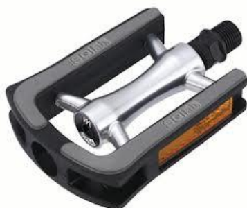
Normale Pedale, auch Footie genannt. Benötigt keine Schuhplatten