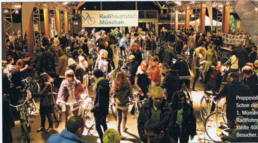
Proppevoll! Schon der 1. Münchner Radflohmarkt zählte 400 Besucher.

Roms größter Flohmarkt, die Porta Portese, dient schon als Kulisse für Vittorio de Sicas Film „Fahrraddiebe“. Auf sein Rad sollte man hier unbedingt achtgeben, während man nach Ersatzteilen dafür sucht ... Immer sonntags 6 bis 14 Uhr. www.roma-antiqua.de