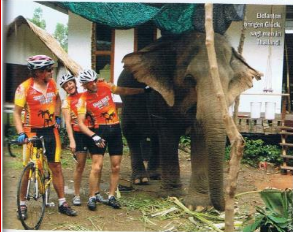
Elefanten bringen Glück, sagt man in Thailand.